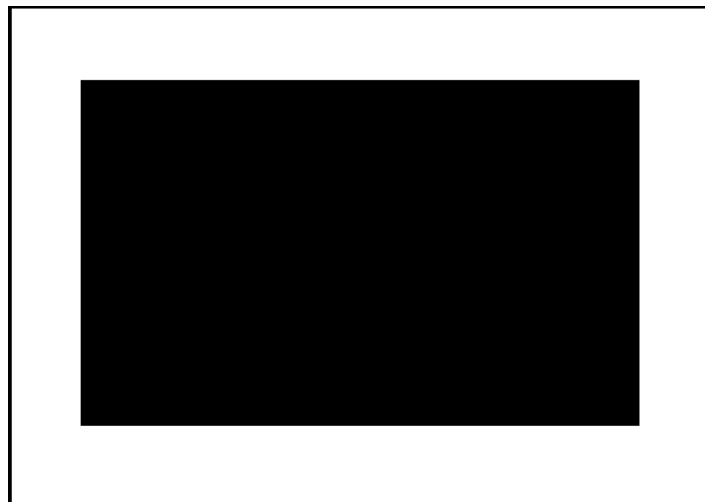
Rysunek 1: Przykładowy obrazek z wyraźnymi krawędziami

W filtrze Sobela dodatkowo wykorzystywane są następujące jądra: